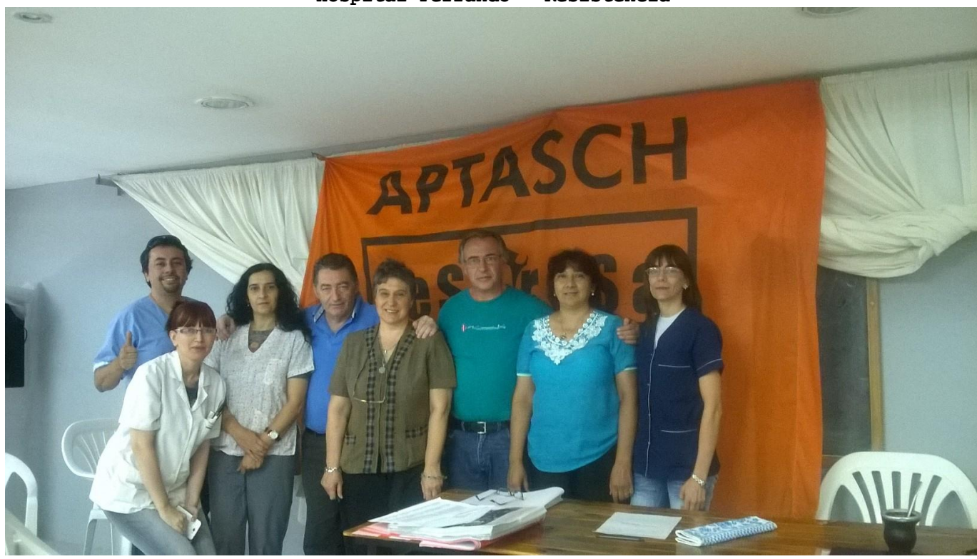
Hospital de Sáenz Peña