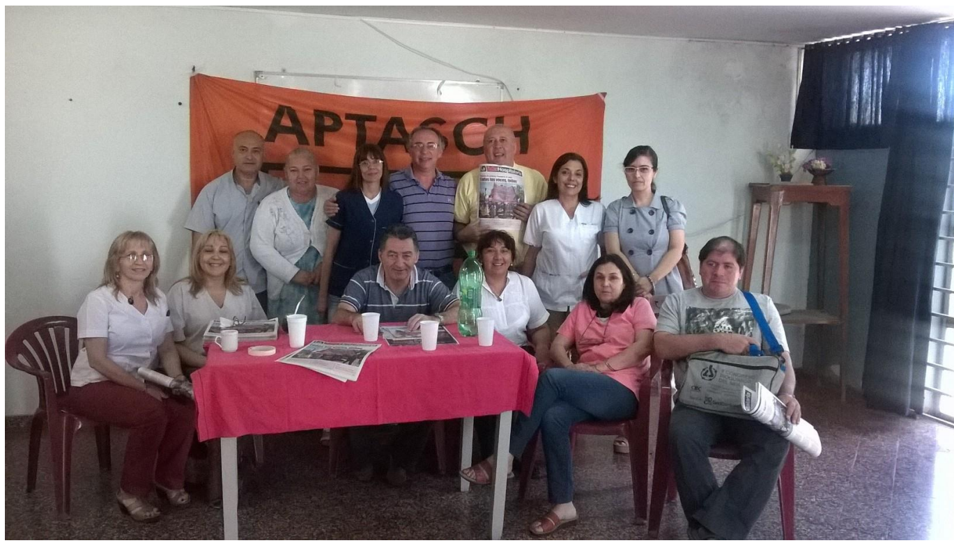
Hospital Perrando - Resistencia