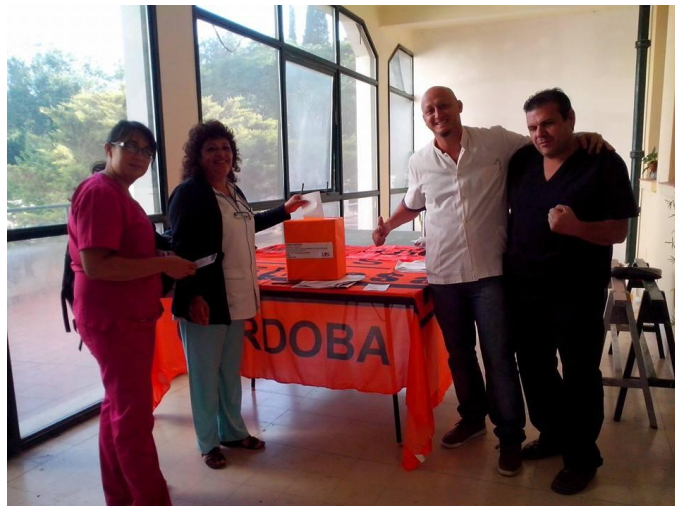
Hospital de Marcos Juárez